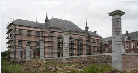
Le Waux-Hall lors des derniers travaux.

Le Waux-Hall est un édifice situé au début de la rue de la Géronstère, à gauche en montant. Il représente l'un des rares témoins architecturaux de l'âge d'or de Spa au XVIIIe siècle et serait l'une des plus anciennes salles de jeux d'Europe. À Spa, ville particulièrement fière de son patrimoine, nous préférons dire qu'il est "le plus ancien casino du monde" ! À cette époque, Spa jouissait d'un réel engouement et attirait la noblesse européenne grâce aux cures et aux jeux ; des maisons de jeux telles que le Waux-Hall leur ouvraient obligeamment les portes.