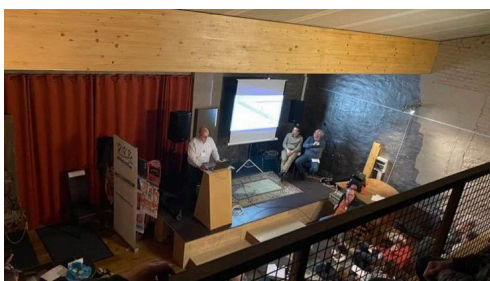
Nous avons déjà organisé toute une série de rencontres citoyennes, comme celle-ci autour de la traversée de Spa et de la place Royale.

À l'approche des élections communales d'octobre 2024 qui marqueront une étape cruciale pour le futur de notre ville de Spa, nous vous invitons à participer