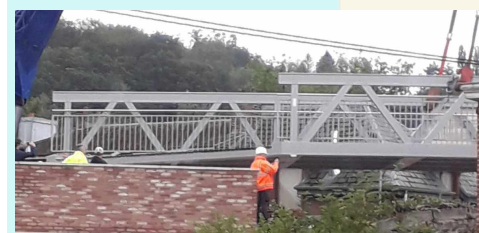
La passerelle permet de relier le chemin Henrotte à la gare de la Géronstère

C'était assez amusant d'assister au lancer de fleurs de la majorité qui se posait en modèle de la mobilité douce lors de l'installation impressionnante de la toute nouvelle passerelle du RAVeL ; un projet qui aurait été finalisé par l'échevin des Travaux, dicit celui-ci, peut-on lire dans les articles de journaux et commentaires FB. Voilà bien une communication qui prête à confusion. Car non, la commune n'a pas été du tout l'acteur principal dans ce dossier qui est un dossier du SPW. Ce n'est pas la commune, en effet, qui gère principalement le dossier du RAVeL ; elle assure seulement entre autres l'entretien et les petits aménagements de celui-ci. On peut donc légitimement se poser la question de savoir ce que l'échevin des Travaux a finalisé dans un dossier qui n'est pas de son ressort. Il vaudrait donc mieux éviter d'utiliser ce genre de propos sur FB : « une liaison subsidiée » (faux, puisque c'est un