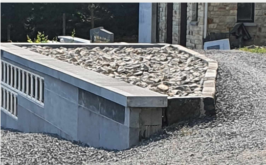
La pelouse de dispersion s'est minéralisée...