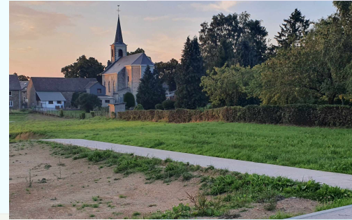
Le chemin vicinal n°69 aujourd'hui.

promeneurs, qui abandonnent la traversée. C'est regrettable, d'autant plus que la Région wallonne ne cesse de valoriser le maillage vert, autant pour la biodiversité que pour la mise en valeur d'espaces plus conviviaux et plus humains. ( Fabienne Dorval )