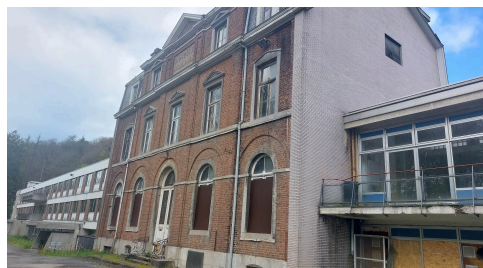
Le projet initial avec le rassemblement Ville - CPAS rue Hanster avait obtenu 4 millions de subsides; il restait 10 millions à charge de la Ville; Somme qui aurait mis les finances communales en grand péril.

Outre le processus participatif pour élaborer les dossiers (voir notre article « Un candidat-bourgmestre et un groupe politique qui pratiquent la participation citoyenne », il y a le financement de ces projets. Une partie vient des ressources de la ville, que ce soit en puisant dans ses réserves ou en empruntant, et une autre partie vient de subventions. Intéressons-nous à ces aides reçues des niveaux supérieurs (Fédération Wallonie-Bruxelles, Service public de Wallonie, FEDER, etc.).