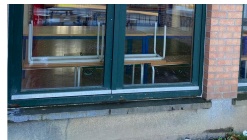
Les châssis de l'école de Creppe n'ont jamais été entretenus