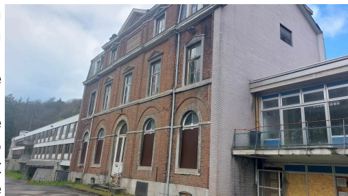
La chapelle St-Charles a été, un moment, menacée par ce projet

On l'a assez répété dans notre journal et en conseil communal : il était impensable de dépenser 10 millions d'argent public (la moitié du budget communal annuel de Spa) pour regrouper les deux administrations sur le site du CPAS, au prétexte de réaliser des économies d'énergie (lesquelles n'auraient jamais été amorties, bien entendu.). Message enfin reçu par la majorité qui, interpellée aussi par des acteurs de la cité inquiets de l'état des finances, a réduit ses prétentions et décidé de laisser pour le moment l'administration communale à l'hôtel de ville, en y opérant toutefois des travaux de rénovation énergétique, et de réaménager autrement le CPAS. (suite en page 2)