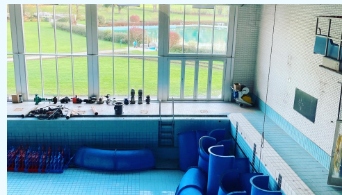
L'ancien bassin doit être rénové lors de la prochaine mandature

Nos jeunes ont formé un groupe de travail spécifique ainsi qu'une association indépendante de notre groupe politique : les JA+. Les activités entre amis manquent de façon criante à Spa, un constat mis en évidence grâce au sondage réalisé par les JA+ en décembre 2021. L'exode des jeunes vers d'autres communes est également visible ; or les jeunes représentent l'avenir de la commune. Alternative-plus est donc fermement décidé à s'engager avec eux et pour eux. Nos objectifs pour la prochaine mandature : leur offrir davantage d'activités et d'aide aux niveaux scolaire, social et professionnel, leur donner la possibilité d'émettre leur avis sur les projets qui les concernent, les intégrer à la vie spadoise, les ouvrir à la culture.