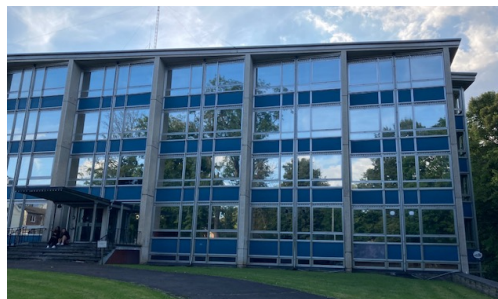
La structure en béton peut être réutilisée, mais ce n'est pas le choix opéré par la Ville.

à la démolition complète de l'ancienne maison de retraite (et maintenant le bâtiment du pôle social), au nom de la motion « Stop béton » et du Plan Climat (car produire du béton et du ciment est une grande source de CO2). Comme l'a dit Frank Gazzard en conseil (et rappelons qu'il est ingénieur en construction et habitué aux chantiers d'importance réputés difficiles), il existe des solutions originales pour conserver les anciens bâtiments, dont les