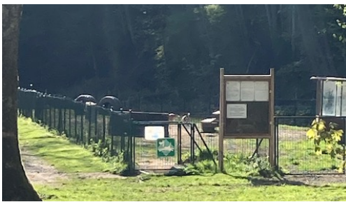
Le parc canin semble menacé par le projet actuel

(suite de l'article - Bon, finalement: on fait quoi?)