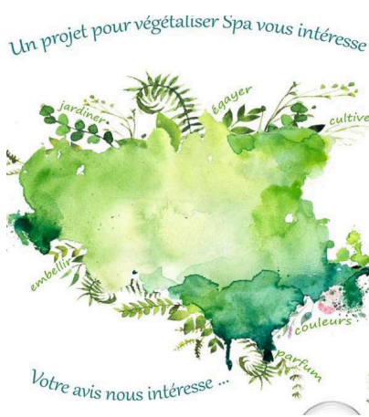
L'affiche de notre campagne sur la végétalisation

Oui, nos idées fleurissent bel et bien, et elles vont même changer le visage de nos rues. Pour Alternative-plus, aménager le trottoir, c'est aussi le végétaliser, une idée émise en 2021 dont nous sommes fiers qu'elle ait enfin été suivie par les autorités. Mais voyons plus grand : la végétalisation n'est pas une conscientisation des riverains à l'entretien de leur trottoir pour leur éviter la répression, contrairement à ce qu'a dit sur Vedia la présidente du CPAS ; c'est tout autre chose ; c'est un autre regard à ouvrir sur le quartier ; c'est un plaisir à offrir aux yeux et aux sens ; c'est une prévention discrète et conviviale des inondations... Alors végétalisons, partout, tout le temps. Végétalisons le pied des arbres et pas seulement le pied des façades ; cela créera de la biodiversité et améliorera leur santé ; végétalisons les coins perdus, comme celui situé entre la rue Jean-Philippe de Limbourg et la rue Tahan : ils