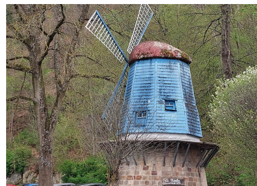
Le moulin du parc de Sept Heures devait être restauré l'année dernière...

but de rénover les berges fortement abîmées lors des inondations de juillet 2021. Visiblement, la berge a tendance à se laisser aller vers le Wayai et les travaux deviennent urgents, la coupe des arbres était donc nécessaire. La réparation revient au demandeur propriétaire de la parcelle et est à charge de celui-ci. Il y aura bien une replantation comprenant 6 arbres hautes tiges (aulnes et saules selon les recommandations de la Région) et un semis de graminées de type prairie fleurie. Claude Brouet : Pourquoi le moulin du parc de Sept Heures n'a-t-il pas encore été repeint alors que les travaux devaient être effectués pour le printemps 2022 ? Parce que, comme il se trouve dans un parc classé, il faut consulter l'AWaP (Agence wallonne du Patrimoine). Et l'aubette de tram accidentée route de Balmoral ? a insisté Claude Brouet ; réponse : la Ville deviendra sous peu propriétaire du terrain sur lequel se trouvent les trois aubettes de tram ; à ce moment-là, elle pourra effectuer les réparations. Le bornage est en cours.