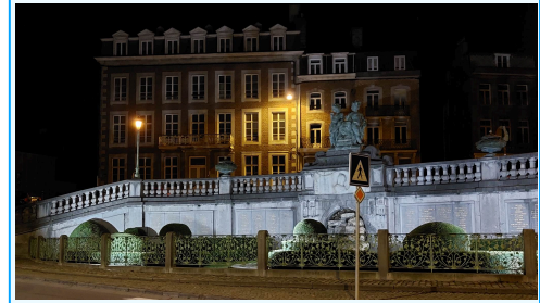
L'Hôtel de Spa est à nouveau à vendre

Les deux précédents candidats s'étant désistés, c'est la deuxième fois que l'Hôtel de Spa (ancienne Académie) va être proposé à la vente pour la somme minimale de 750 000€. Les conditions sont les suivantes : logement intergénérationnel et tourisme, commerce et petit HoReCa, afin de redynamiser le quartier et d'améliorer son image. Attention à diffuser très largement l'avis de vente, a noté Frank Gazzard , qui s'est inquiété aussi de la présence possible d'une auberge de jeunesse et du partage de l'espace-jardin des résidents avec des badauds extérieurs.